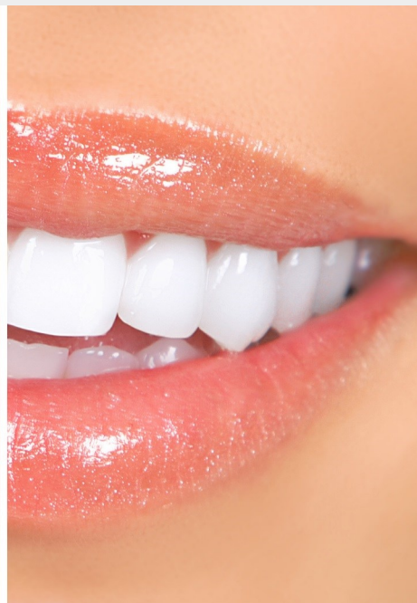
Deutlicher Unterschied: Professionelles Bleaching beim Zahnarzt wirkt!