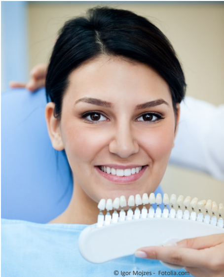
Bleaching vom Zahnarzt: Gewinnendes Lächeln mit strahlend weißen Zähnen