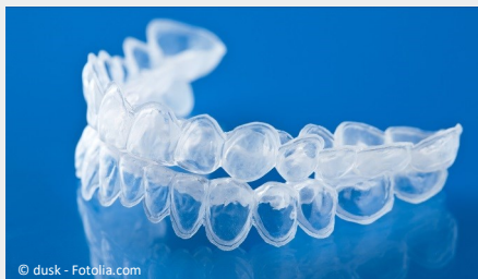
Bleaching-Form aus Kunststoff, in die Sie das Aufhellungs-Gel einfüllen.

Beim Home-Bleaching werden vom Zahnarzt dünne flexible Formen aus einem transparenten Kunststoff hergestellt, die genau auf Ihre Zähne passen (siehe Foto).