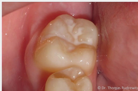
Schutz vor Karies: Versiegelung der feinen Grübchen auf der Kaufläche

Bei der Versiegelung werden die Fissuren mit einem hellen Kunststoff dauerhaft verschlossen, so dass an diesen Stellen keine Karies mehr entstehen kann (siehe Abb. unten).