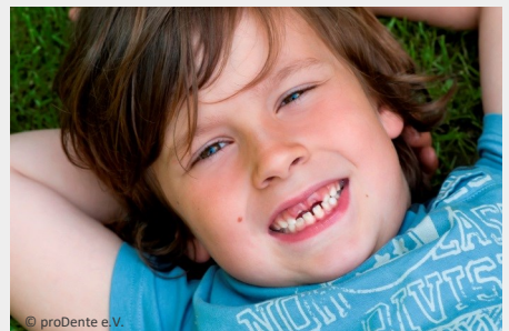
Bei der Prophylaxe lernen Ihre Kinder die richtige Zahnpflege

Es gibt also keinen Grund, warum Sie auf Prophylaxe für Ihre Kinder verzichten sollten.